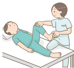
身体機能の維持・改善