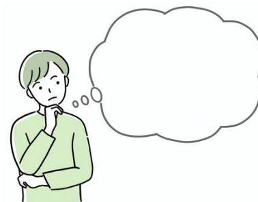
今後の回復の予測

ご利用を希望される際は担当のケアマネジャーさんに相談してみてください。 担当医の先生やケアマネジャーさんと連携してお手伝いを開始します。